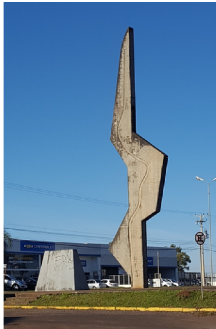
Figura 01- Monumento Coluna Prestes

O conceito surgiu a partir do histórico do município. Sabe-se que a Catedral Angelopolitana é um ponto de referência para a cidade, porém, no decorrer da história, ocorreram outros fatos importantes. O Monumento Coluna Prestes (figura 1), projetado pelo arquiteto Oscar Niemeyer, é uma obra digna de valorização por sua história e pela importância arquitetônica, que representa esta marcha revolucionária em que teve ponto de partida na cidade.